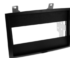
Masque et supports métalliques