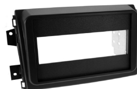
Mascherina e staffe metalliche