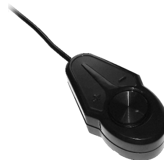
Commande à distance du niveau