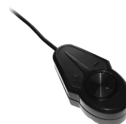
Contrôle du niveau à distance